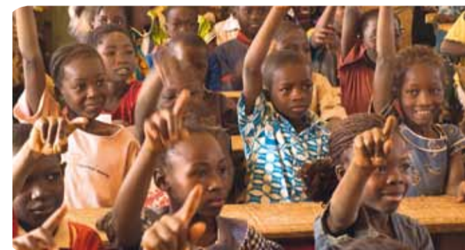
Les écoliers de Banfora

2011 fera la part belle aux artistes burkinabés en l'honneur de Banfora, notre nouvelle amie (voir « 3 questions à ») ! Une cérémonie officielle de signature de la coopération est ainsi prévue, samedi 28 mai, à 12h30, place de la V e République, en présence de Souleymane Soulama, Maire de Banfora. Difficile de trouver meilleure façon de fêter cette nouvelle amitié qu'à l'occasion des Rencontres Africaines .