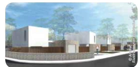
* Bâtiment Basse Consommation

Rens. Direction de l'Aménagement urbain 05 57 93 65 91 - amenagement@mairie-pessac.fr