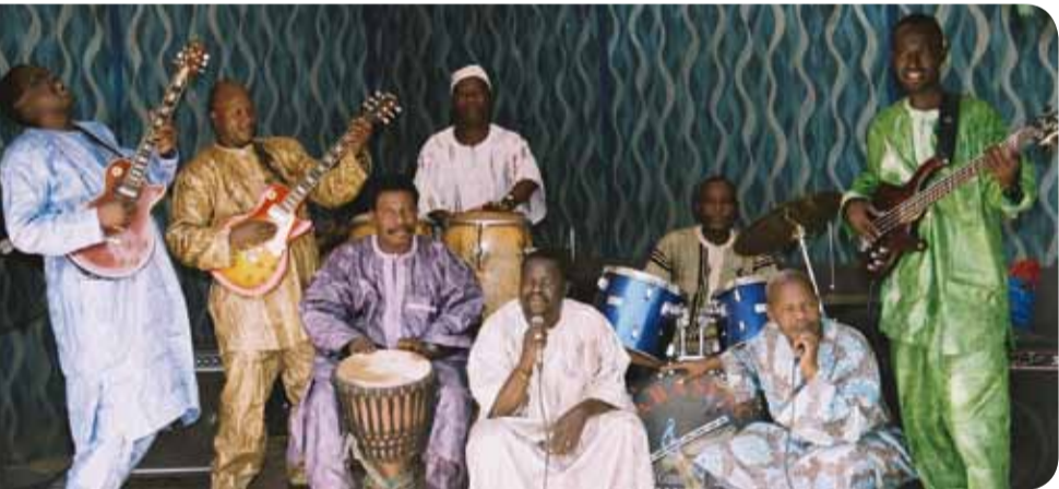
Le Super Rail Band de Bamako

Rens. Direction de la Culture : 05 57 93 67 11 / culture@mairie-pessac.fr